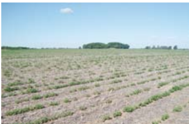
Pérdida de plantas por hongos del suelo.

En cambio, cuando se manifiestan durante el cultivo o previo al arrancado producen graves pérdidas de rendimiento y de calidad del grano.