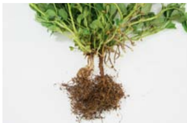
Agallas producidas por nematodos en raíces.

El agente causal encontrado es Meloidogyne arenaria , nematodo formador de agallas en raíces, clavos y vainas. En el tejido vascular afectado de las distintas partes de la planta se interrumpe el paso de agua y nutrientes afectando el normal crecimiento y en consecuencia