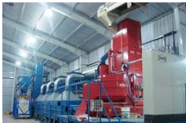
Planta de tratamiento de semillas con polímero.

táneamente los fungicidas con polímeros que brindan una cobertura uniforme, disminuyendo el deterioro físico (pelado, partido y/o quebrado).