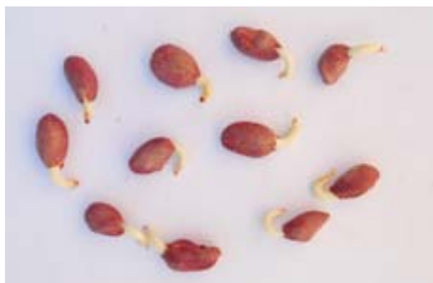
Semillas de maní de buen poder germinativo tratadas con polímeros mas fungicidas