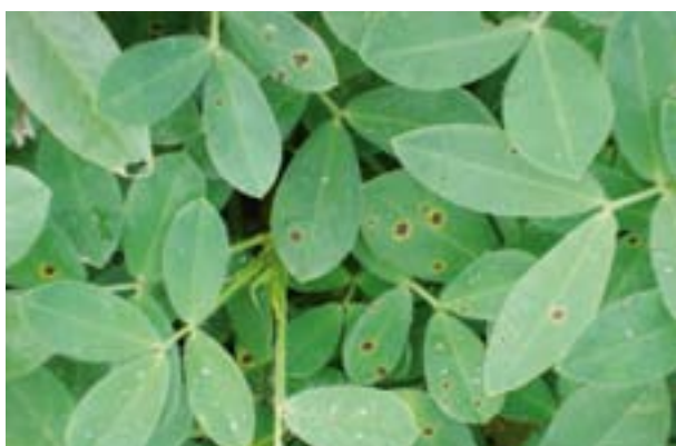
Hojas con síntomas de viruela

La viruela temprana, Cercospora arachidicola y la viruela tardía Cercosporidium personatum , son las enfermedades foliares más comunes del cultivo de maní en la provincia de Córdoba. Producen defoliación, debilitamiento de tallos y de clavos y en consecuencia, reducción en los rendimientos, lo que se agrava cuando se demora el arrancado. Estas pérdidas pueden ser evitadas con un adecuado programa de control de la enfermedad.