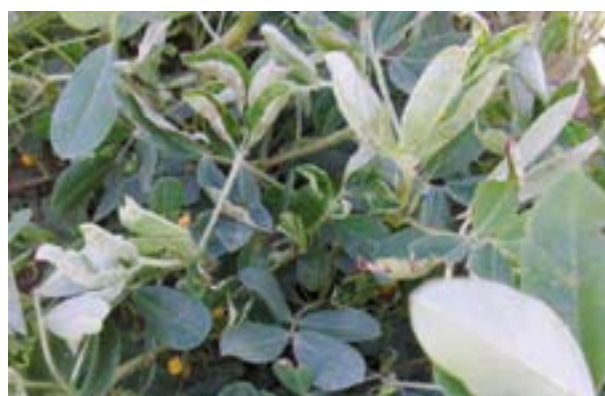
Planta con síntoma de sarna.

Sarna, Sphaceloma arachidis , se manifiesta en los pecíolos, tallos y clavos, observándose manchas de aspecto corchoso. Con el desarrollo de la enfermedad todas estas lesiones toman una coloración olivácea debida a las fructificaciones del hongo y al mismo tiempo los márgenes de los folíolos se doblan hacia arriba originando un típico enrulamiento de la parte apical.