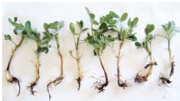
Plántulas con daños en raíces por hongos del suelo.

Las enfermedades que se desarrollan sobre o debajo de la superficie del suelo son de difícil diagnóstico.