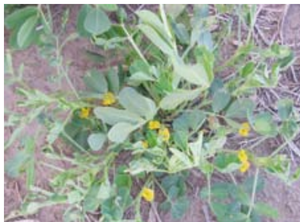
Planta con síntoma de virosis

El cultivo de maní es afectado por distintas virosis que producen pérdidas de rendimiento y calidad de los granos cosechados. La virosis que se encuentra con mayor dispersión en la provincia de Córdoba es producida por un tospovirus llamado Peanut Mottle Virus . El mismo se transmite por medio de la semilla y pulgones. El control es preventivo y comienza con la siembra de semillas libre de virus.