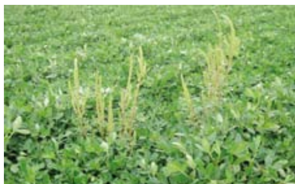
Maleza de difícil control en maní.