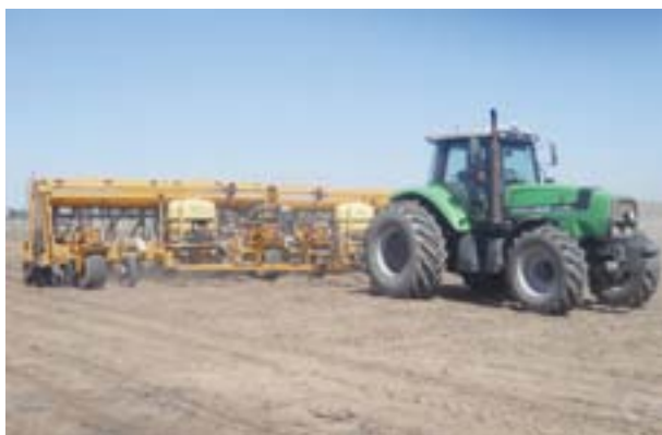
Sembradora neumática con equipo aplicador de inoculante líquido.

El maní es una planta leguminosa que tiene capacidad para fijar el nitrógeno del aire a través de bacterias que forman nódulos en sus raíces. La ausencia de las bacterias específicas, la sequía, el anegamiento o la formación de costras que limiten la aireación del suelo, disminuyen o impiden la fijación de nitrógeno. Cuando la disponibilidad de nitrógeno no es suficiente, el follaje del cultivo presentará un color verde claro a ligeramente amarillento. Los primeros síntomas se observan en las hojas inferiores. La falta de nitrógeno generalmente no es observada durante el estado vegetativo del cultivo. Los síntomas aparecen cuando el cultivo comienza el estado repro-