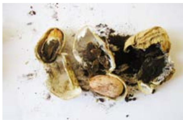
Síntomas de carbón en maní

Es la enfermedad que ha tenido mayor difusión en el área manisera en los últimos años. El agente causante es Thecaphora frezzii el cual sobrevive en el suelo. Las vainas afectadas son fácilmente distinguibles por una hipertrofia de sus paredes, ser de mayor tamaño y en su interior se observa una masa carbonosa con destrucción total o parcial de los granos. Hasta el presente se han evaluado distintas alternativas para su control, como son diferentes tipos de labranza, rotaciones, uso de diversos cultivares, fungicidas aplicados a la semilla y al suelo y fertilizantes o enmiendas. Ninguna