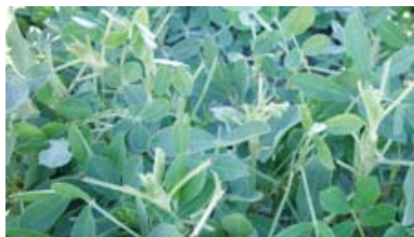
Daño en brotes terminales por orugas defoliadoras.

En este grupo se incluyen todas las orugas que se alimentan del follaje de la planta. En la mayoría de los años no son un problema. En este agrupamiento se incluyen la oruga bolillera ( Helicoverpa sp. ), isoca militar tardía ( Spodoptera spp. ), isoca medidora ( Rachiplusia sp. ) y otras. Una elevada población de estas larvas, (mas de 6 por metro) cuando las plantas son muy pequeñas pueden causar graves daños y por lo tanto se debe aplicar inmediatamente un insecticida. Otro período crítico es durante el período reproductivo, ya que dichas larvas pueden atacar flores y clavos y reducir el potencial de rendimiento. Durante este período el control debe realizarse si se encuentran mas de 2 larvas por metro.