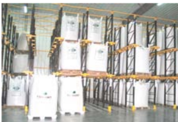
Almacenado de maní terminado

Antes del almacenamiento, tan importante como el secado es la prelimpieza para eliminar cajas inmaduras, granos sueltos, raíces, palos, restos de malezas, tierra y cualquier otro material extraño. No debe almacenarse un maní con más de 4% de material extraño o 5% de granos sueltos.