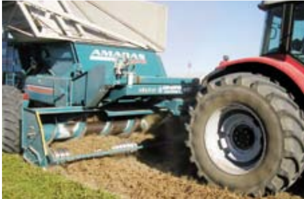
Cosechadora de doble hilera.

Cuando se dispone de facilidades para secar la producción, la cosecha puede realizarse cuando el maní tiene entre 18 y 22 % de humedad. Si el maní será almacenado en el campo sin previo secado artificial, la humedad del maní no deberá superar el 10%.