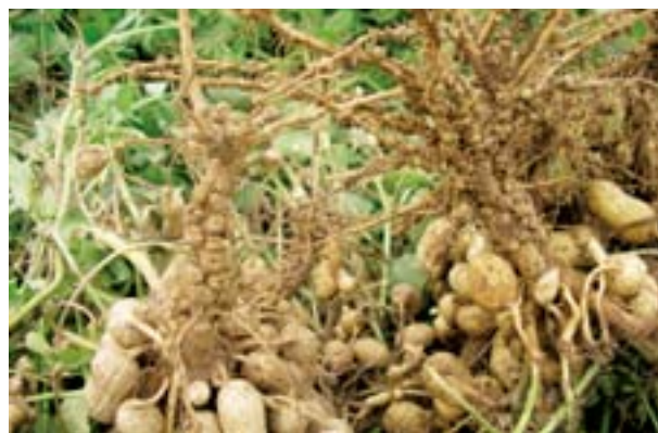
Nódulos en raíces de plantas provenientes de cultivo inoculado.

En cambio, en campos donde nunca se ha sembrado maní o donde hace muchos años que no se lo cultiva, es necesario aplicar inoculantes que introducen al suelo la bacteria fijadora de nitrógeno. Los mismos pueden aplicarse en forma líquida en el surco de siembra o tratando la semilla con inoculantes en base turba. Actualmente se evalúa el preinoculado de la semilla con resultados promisorios.