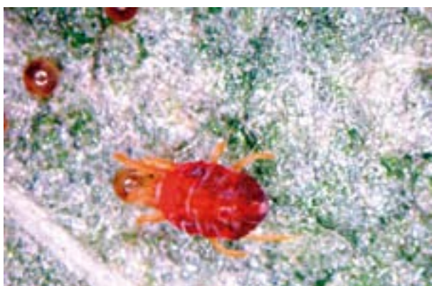
Arañuela adulta y huevos.

Las arañuelas ( Tetranychus sp. ) producen daños a la planta al succionar el contenido de las células desde el envés de las hojas. La presencia de arañuelas se observa en manchones dentro del lote, especialmente a lo largo de las cabeceras, manifestando las plantas un aspecto amarillento grisáceo. Cuando el ataque es intenso las plantas mueren.