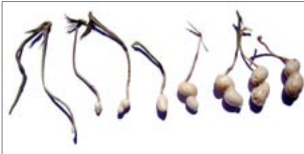
Evolución de "clavo" a vaina

Como cualquier otro cultivo, el maní requiere una cuidadosa planificación de tareas previas y durante el cultivo para lograr elevados rendimientos y excelente calidad de la producción. A continuación se encontrará una breve descripción de los principales aspectos a considerar.