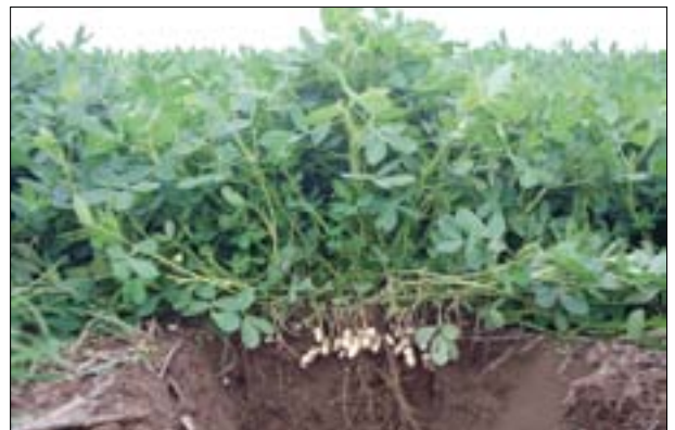
Estado de una planta de maní a los 100 días.

El maní tiene necesidades especiales de nutrición debido a que los frutos crecen en el suelo, por lo tanto, es muy importante la fertilidad de la capa de suelo donde se desarrollan "clavos" y vainas.