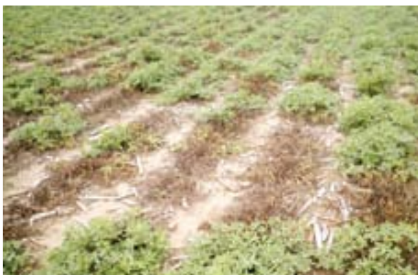
Muerte de plantas por enfermedades del suelo.

En cambio, cuando se manifiestan durante el cultivo o previo al arrancado producen graves pérdidas de rendimiento y de calidad del grano.