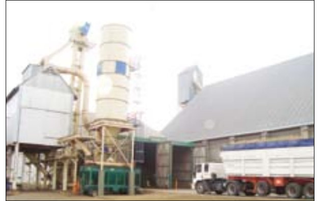
Área de descarga.

Actualmente el secado del maní es uno de los pasos más importantes en el proceso de obtención de maní de alta calidad.